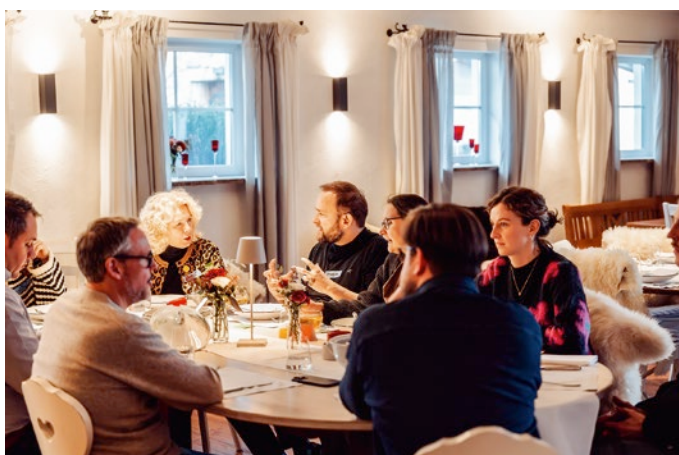
Die Mitglieder treffen sich regelmäßig zum Austausch.

Die wirtschaftliche Realität der Betriebe ist uns sehr bewusst – viele Mitglieder der AVE verantworten große Küchen- und Versorgungsstrukturen. Unser Ansatz ist deshalb ausdrücklich praxisorientiert. Nachhaltigkeit wird nicht als Zusatzaufgabe verstanden, sondern als Teil einer intelligenten Betriebsführung. Viele Maßnahmen, die ökologische Wirkung entfalten, können gleichzeitig wirtschaftliche Vorteile bringen: etwa eine kluge Menüplanung, weniger Lebensmittelverschwendung, einen stärkeren pflanzenbasierten Speiseanteil oder effizientere Produktionsprozesse. Entscheidend ist der Erfahrungsaustausch zwischen den Betrieben. Wenn Küchenleitungen sehen, wie andere Häuser ähnliche Hürden überwunden haben, entstehen realistische Wege, die auch unter herausfordernden Rahmenbedingungen funktionieren können.