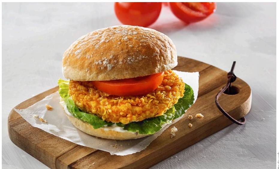
Bei herzhaft belegten Brötchen hat Backwerk pflanzliche Optionen im Sortiment, z. B. den Plant based Crunchy Chicken.

Die Anbieter setzen auf eine so nahe liegende wie einfache Formel: den Geschmack. „Apfeltasche, Schweinsohr und Franzbrötchen sind bei uns schon seit vielen Jahren rein pflanzlich – so lange, dass das für unsere Kundinnen und Kunden im Alltag eigentlich gar kein Thema mehr ist. Sie kaufen diese Gebäcke vor allem, weil sie einfach gut