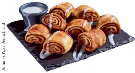
Domino's Pizza Deutschland

Die neuen pflanzlichen Cinnamon Rolls mit Sweet-Icing-Dip von Domino's bringen eine willkommene Abwechslung beim Dessert.