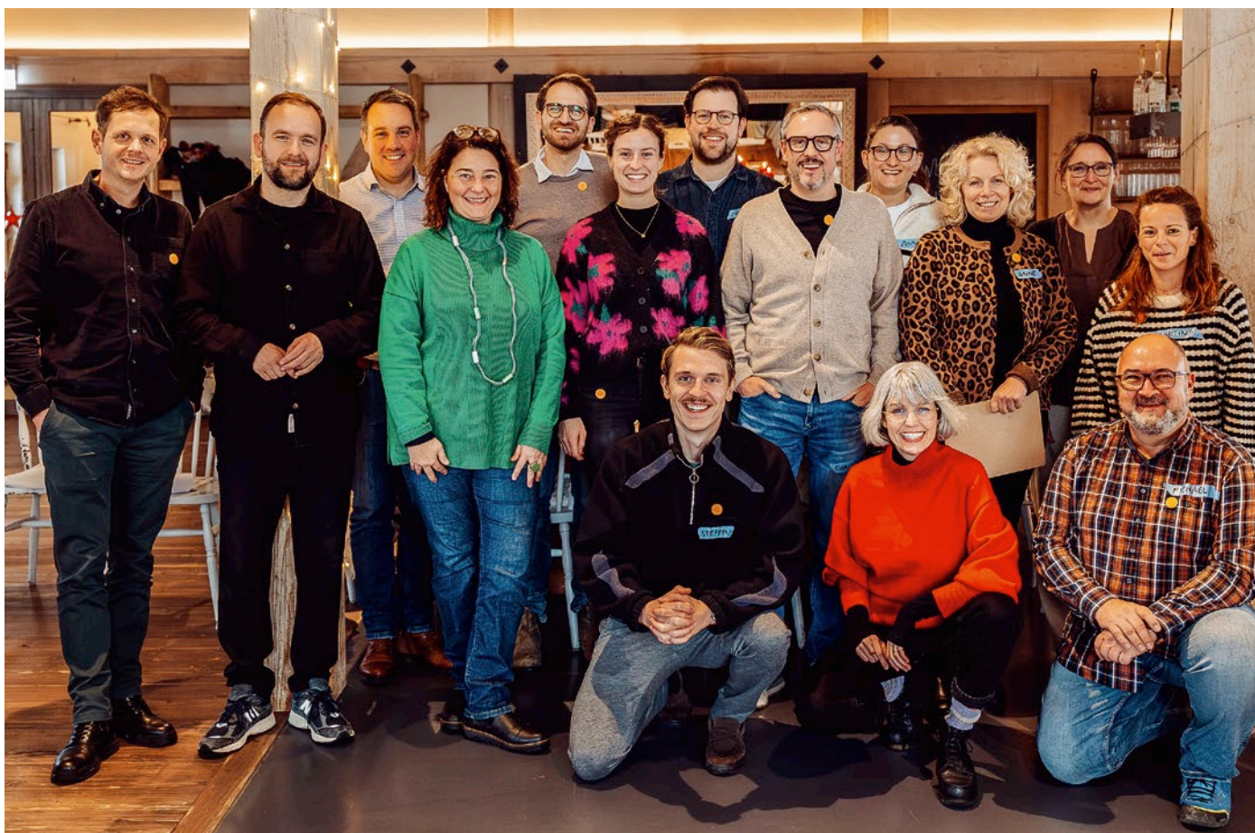
Mitglieder der AVE während eines Treffens.

Dazu gehören zum Beispiel ein höherer Anteil pflanzlicher, ökologischer und saisonaler Lebensmittel in der Speiseplanung, der Ausbau fairer und langfristiger Lieferbeziehungen sowie ein bewussterer Umgang mit Ressourcen – etwa durch die Reduktion von Lebensmittelverschwendung und eine stärkere Ausrichtung auf Ernährungsqualität.